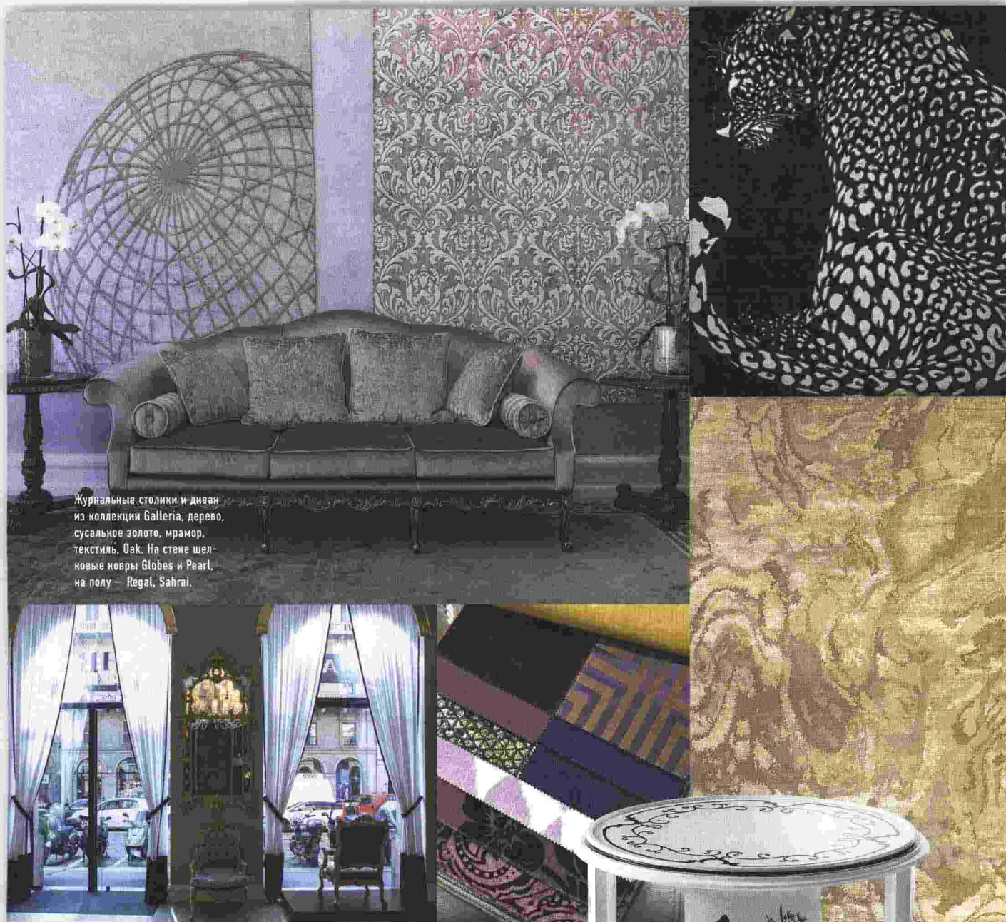
Журнальные столики и диван из коллекции Galleria, дерево, сусальное золото, мрамор, текстиль. Oak. На стене шелковые ковры Globes и Pearl, на полу — Regal, Sahrai.

ТЕКСТ: ОЛЬГА СОРОКИНА